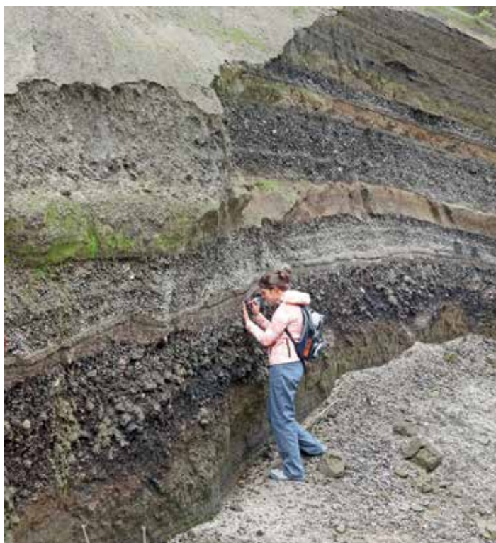
Рис. 6. Термальная стенка – участок разгрузки тепловой энергии крупной гряды горячей пирокластике извержения 2005 г.