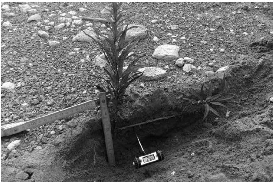
Рис. 7. Иван-чай узколистый – одно из пионерных растений, растущих на вулканическом субстрате с повышенной температурой. 2011 г.

опушечный эффект, и среди пионерных растений заметно больше древесных (мелкий подрост ели, лиственницы, березы, кедрового стланика, тополя и ивы удской). Древесный подрост состоит почти исключительно из березы каменной вдоль северного борта долины и со значительным участием хвойных вдоль южного борта.