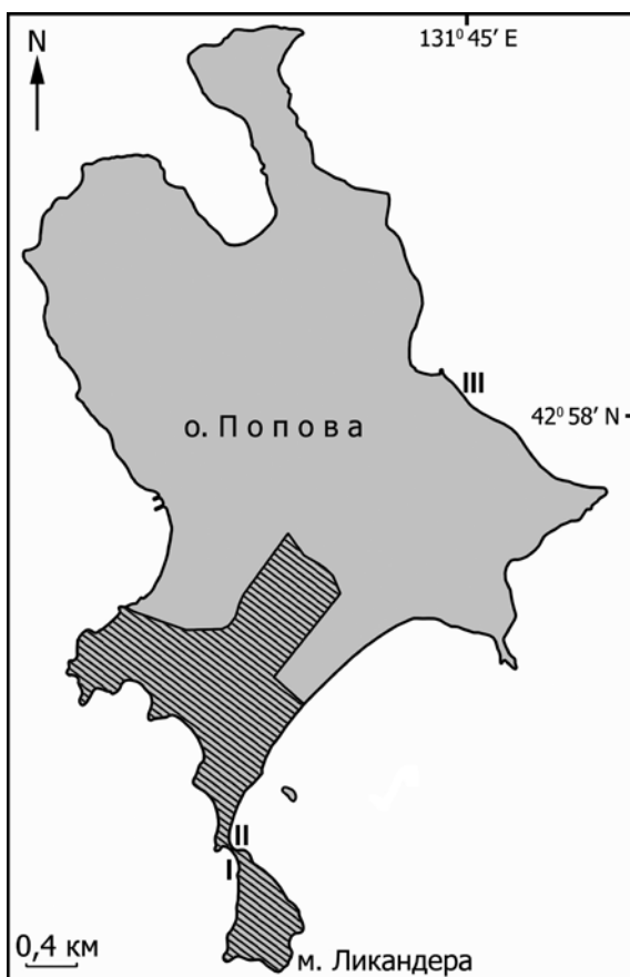
Рис. 1. Карта-схема о-ва Попова. Районы исследований: I – п-ов Ликандера, Амурский залив, II – п-ов Ликандера, Уссурийский залив, III – окрестности пос. Старк, прол. Старка. Штриховкой выделена территория Северного участка Дальневосточного морского заповедника

Ранее по данным инвентаризационной сводки Дальневосточного морского биосферного заповедника [1] для Северного участка и сопредельных территорий указывалось 195 видов сосудистых растений. Для флоры бухты Пограничная, омывающей п-ов Ликандера со стороны Уссурийского залива, приводится 41 вид, для полуострова в целом –