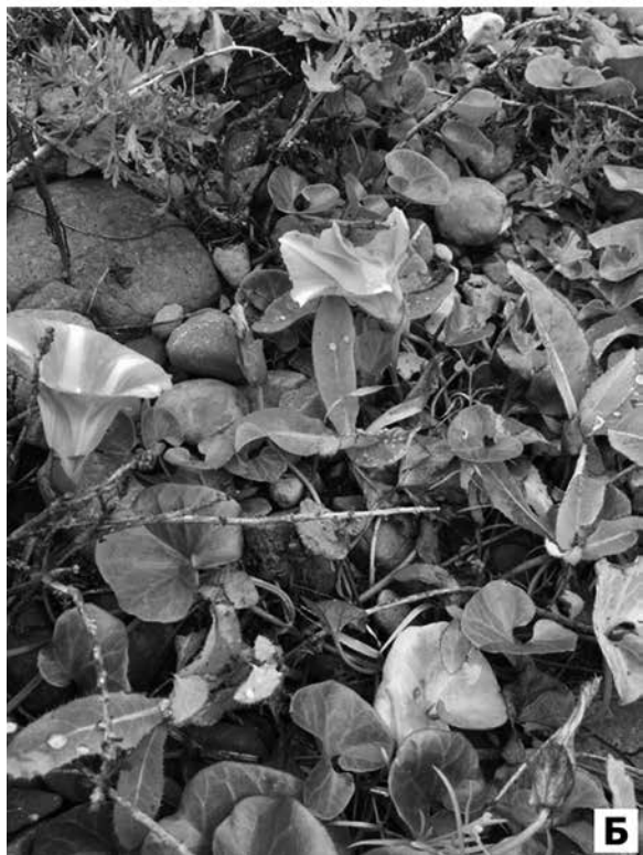
Рис. 3. Редкие виды, занесенные в Красную книгу Приморского края: А – Argusia sibirica (L.) Dandy (аргузия сибирская), Б – Calystegia soldanella (L.) R. Br. ex Roem. et Schult. (повой сольданелловый)

Neoussuria firma (= Silene firma Siebold et Zucc., = Melandrium firmum (Siebold et Zucc.) Rohrb.) (новоуссурия крепкая): Аск, БПел, Лис, Поп, Пут, Рик, Рус, Фур. Встречается в дубняках и кустарниковых зарослях. Вид обнаружен в нетипичном местообитании – на супралиторали в окрестностях пос. Старк, на границе галечного пляжа и невысокого берегового вала.