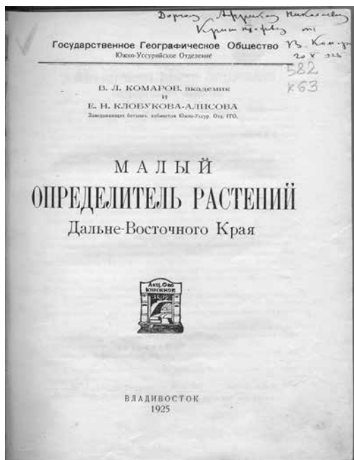
Рис. 6. Титульный лист монографии В.Л. Комарова и Е.Н. Клобуковой-Алисовой «Малый определитель растений Дальневосточного края» (владельческий экземпляр А.Н. Криштофовича с дарственной надписью В.Л. Комарова)

в этом качестве позволяет не только получить большой объем данных об истории научных учреждений Дальнего Востока, но и оценить межличностные связи и высокий уровень книжной культуры ученых. Важно и то, что библиотека не была сформирована с нуля, в нее вошли фонды ранее существовавших библиотечных учреждений и издания из личных собраний. Все это придает коллекции статус уникального источника информации.