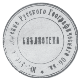
Рис. 2. Штамп библиотеки ЮУО РГО с текстом «Ю.-Усс. Отделение Русского Географического Об-ва. Библиотека»