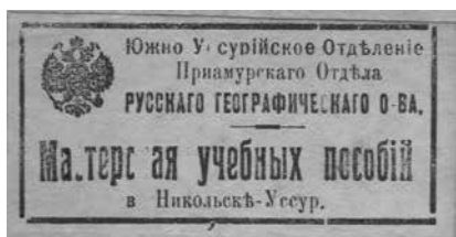
Рис. 3. Наклейка переплетной мастерской ЮУО РГО

Клавдиевич Арсеньев (1872–1930) – исследователь Дальнего Востока, путешественник, этнограф, писатель.