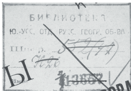
Рис. 1. Штамп библиотеки ЮУО РГО с текстом «Библиотека Ю.-Усс. Отд. Русс. геогр. об-ва»

1. Арсеньев В.К. Тихоокеанский морж. Владивосток: Кн. дело, 1927. 40 с. Владельческий знак: автограф с текстом: «В библиотеку Южно-Уссурийского отдела русского географического общества от автора» (рис. 4). Владимир